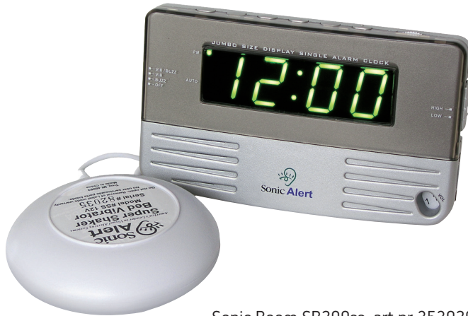
Sonic Boom SB200ss, art nr 353020