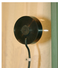
UniVox® 13V mikrofon för glasruta/vägg