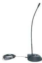
UniVox® M-1 svanhalsmikrofon