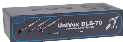
UniVox® DLS-70 slingförstärkare