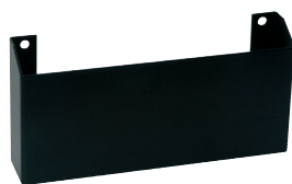
Väggållare för UniVox® DLS-50 slingförstärkare